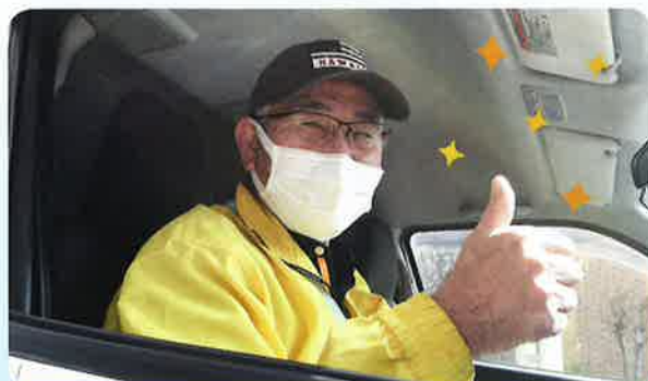
笑顔が素敵なドライバー Hさん