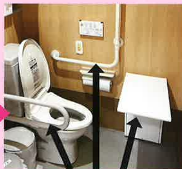
前方左右への転倒防止策