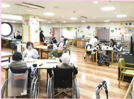
大部屋フロアお食事の様子