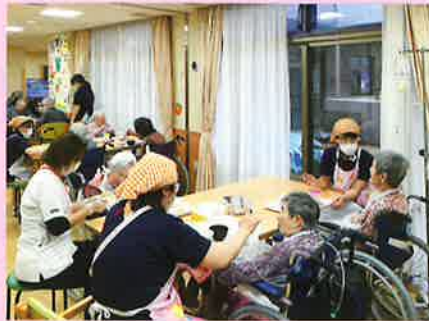
個室フロアお食事の様子