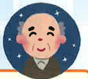
認知症 基礎・応用