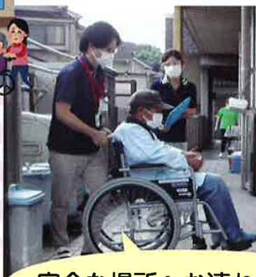
安全な場所へお連れします