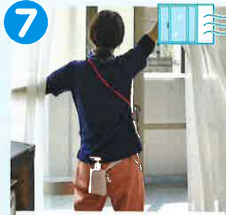
時間を決めての換気