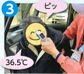
送迎前の体温測定