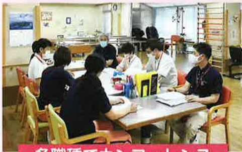
多職種でカンファレンス

本人さんの気持ちが折れてしまわないよう、多職種で自宅復帰を目指しアプローチをしました。