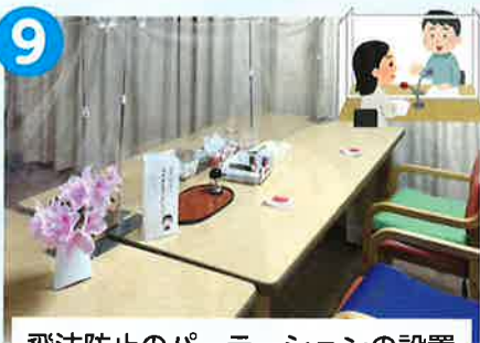
飛沫防止のパーテーションの設置