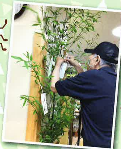
ささのは～ さ～らさら～ (^^)