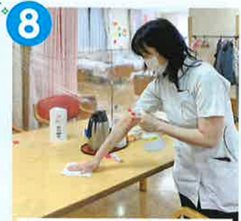
こまめな備品消毒