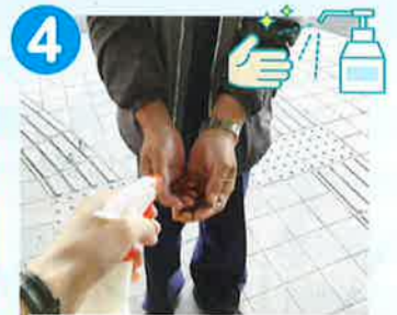
来所時に手指消毒