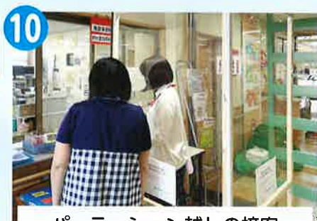
パーテーション越しの接客