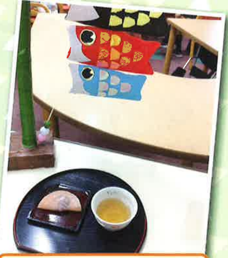
完成した鯉のぼりと お茶の時間です♡