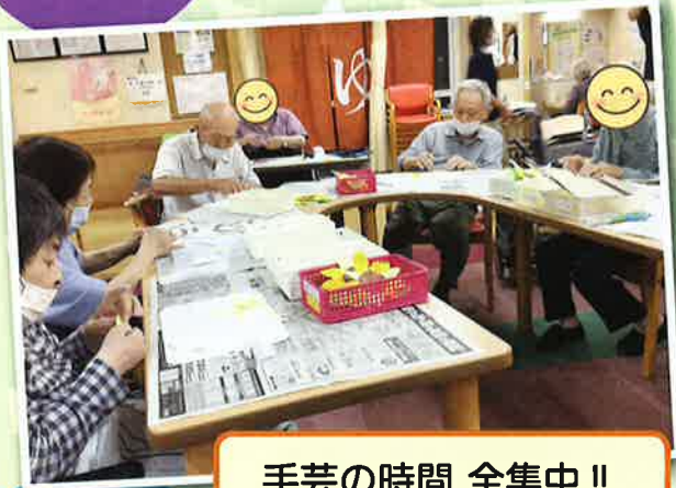
手芸の時間 全集中!!