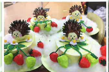
癒しのオブジェ “莓ハリネズミ”