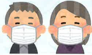
利用者様のマスク着用