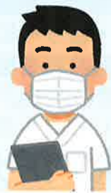
職員のマスク着用