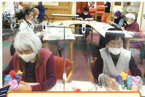
素敵なバラが出来ました🌹