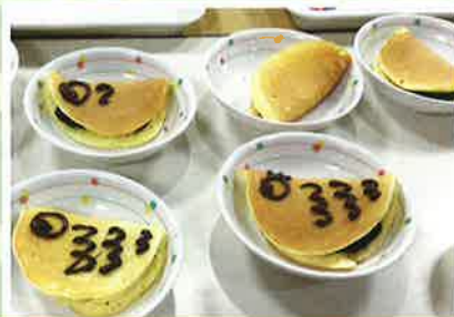
ふわふわの手作りおやつで一服