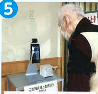
来所時や日中の体温測定