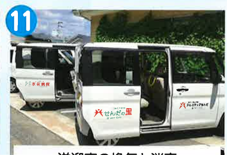
送迎車の換気と消毒