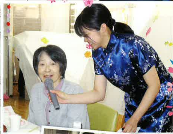
みんなで合唱～春の小川～♪