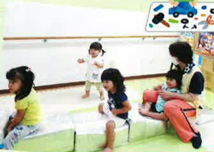
箱を組み合わせて列車を作ったよ!!