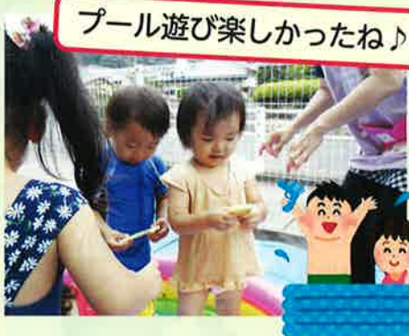
プール遊び楽しかったね♪