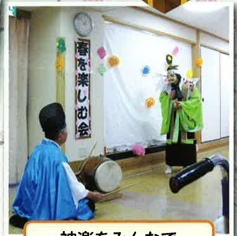
神楽をみんなで楽しみました