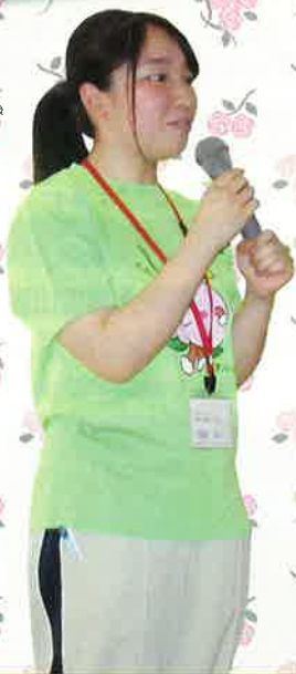
新入職員の自己紹介と質問タイム