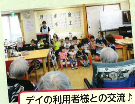
デイの利用者様との交流♪