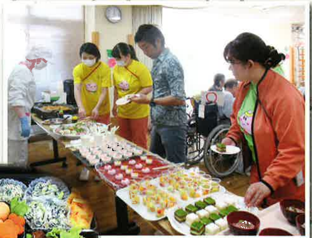
美味しそうなオードブルと春のスイーツがたくさん★