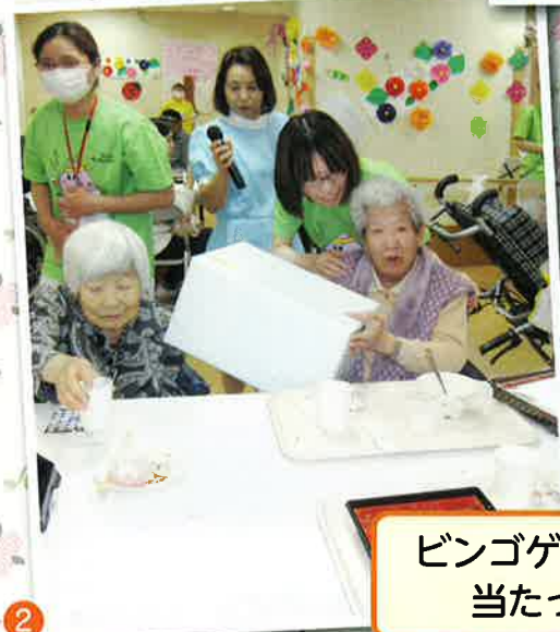
ビンゴゲームで景品当たったよ～