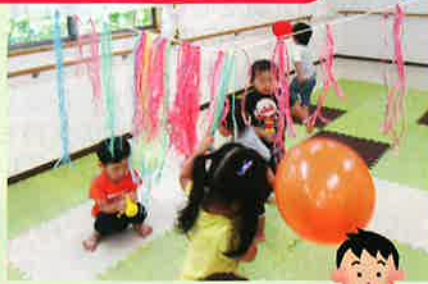
風船バレー楽しいな♪